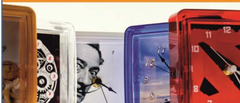
ЧАСЫ ФОТО КАМНИ, СТЕКЛА, ПЛАКЕТКИ